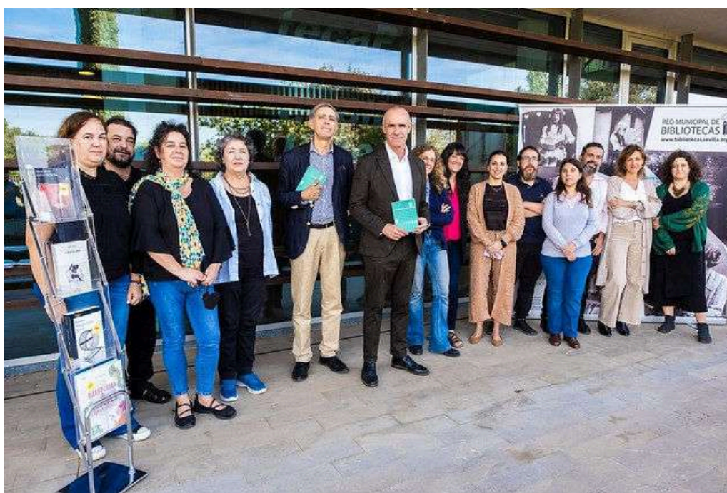
RP_ plan de Bibliotecas ©Pepo Herrera-22