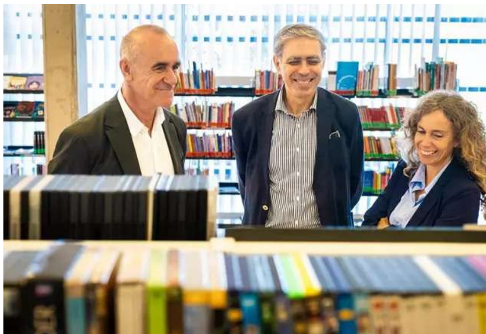
El alcalde de Sevilla, en una de las bibliotecas que conforman la red municipal, con ocasión del día mundial de estos espacios.